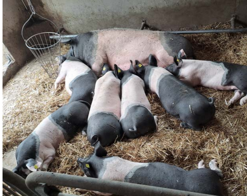
Al Rabensteinerhof i maiali se la spassano bene