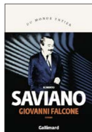
Roberto Saviano: "Giovanni Falcone", Editore: Gallimard 2025, EAN: 9782073007001, prezzo: 18,00 euro

Il 23 maggio 1992, nei pressi di Palermo, un attentato mafioso uccide Giovanni Falcone, il magistrato che aveva dedicato la vita a combattere Cosa Nostra. Nel suo nuovo romanzo-inchiesta, Roberto Saviano ripercorre le tappe di quella lunga battaglia: dagli inizi solitari fino ai grandi successi giudiziari, passando per il dolore dovuto alla perdita dei colleghi e la consapevolezza di vivere ogni giorno sotto minaccia. Con uno stile incisivo, l'autore descrive i tentacoli della mafia e rende omaggio al coraggio di chi, nonostante la paura, sceglie di andare avanti.