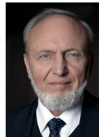
Il prof. Hans-Werner Sinn, relatore al Simposio degli investitori

Il 14 maggio 2026 , si ripeterà l'ormai tradizionale appuntamento con il Simposio degli investitori organizzato da Raiffeisen InvestmentClub, che quest'anno si terrà alla Fiera di Bolzano. L'evento rappresenta un'occasione unica per conoscere più da vicino gli attuali sviluppi economici e acquisire strumenti utili a prendere decisioni finanziarie più consapevoli e sicure.