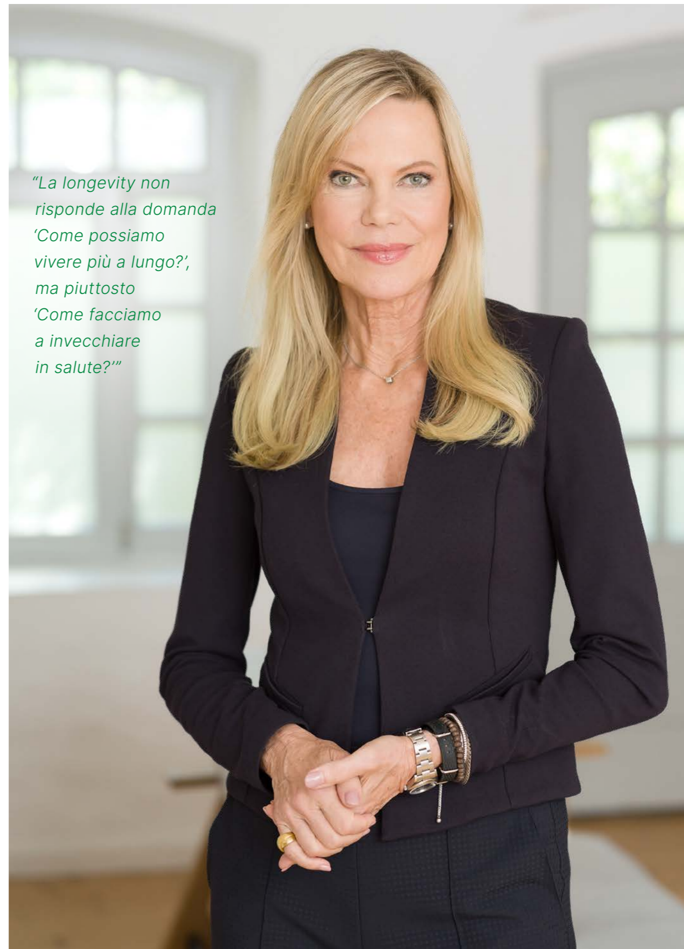
Nina Ruge, biologa e autrice di bestseller

"La longevity non risponde alla domanda 'Come possiamo vivere più a lungo?', ma piuttosto 'Come facciamo a invecchiare in salute?'"