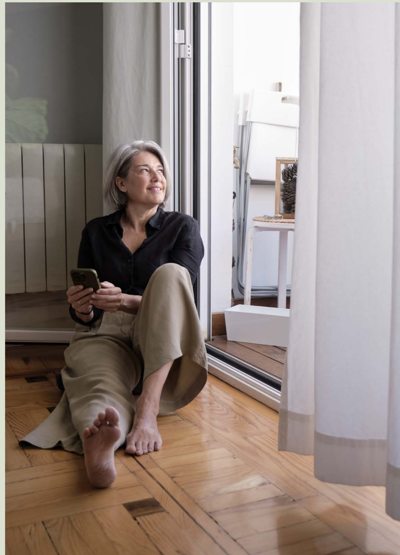
Gli anni della maturità comportano più stabilità ed equilibrio

L’invecchiamento della società sta producendo rapidi cambiamenti in numerosi ambiti sociali