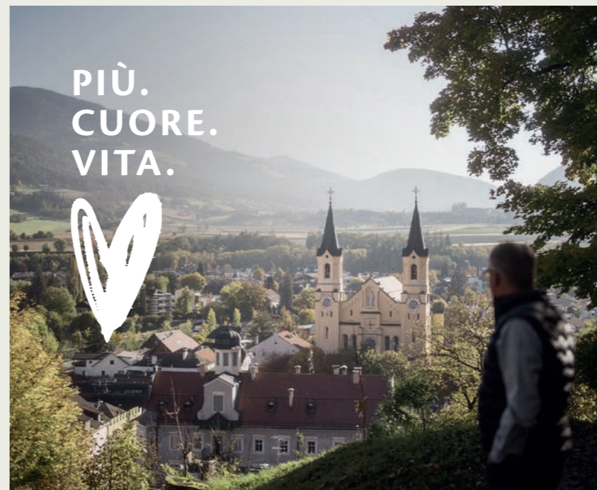
Momenti che lasciano il segno nella quotidianità bancaria: un progetto speciale della Cassa Raiffeisen di Brunico

In occasione di San Valentino, la Cassa Raiffeisen di Brunico ha lanciato una campagna destinata a durare ben oltre questa ricorrenza: al motto PIÙ.CUORE.VITA. , l'iniziativa ha fatto luce sulla passione che si cela dietro una banca e sui momenti speciali che nascono dall'incontro tra le persone.