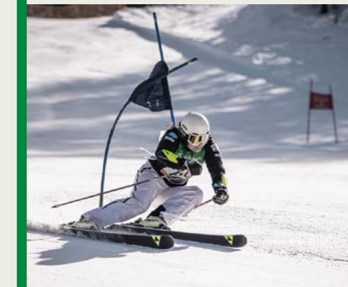
Ein perfekter Schwung im Schnee – voller Einsatz beim Raiffeisen-Wintersporttag.

Der 48. Raiffeisen Wintersporttag im Skigebiet Drei Zinnen im Hochpustertal lockte Anfang März rund 750 Teilnehmende zu einem unvergesslichen Winter-event . Dank bester Bedingungen und der professionellen Organisation durch die Raiffeisenkasse Hochpustertal und den