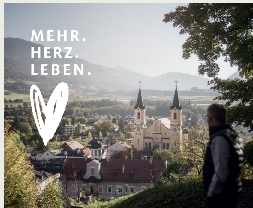
Herzmomente im Bankgeschäft – ein besonderes Projekt der Raiffeisenkasse Bruneck.

Am Valentinstag hat die Raiffeisenkasse Bruneck eine Kampagne gestartet, die weit über diesen einen Tag hinausreicht: Mit MEHR.HERZ.LEBEN. zeigt sie, wie viel Herz in einer Bank stecken kann – und wie viele besondere Momente entstehen, wenn Menschen einander zuhören und begegnen.