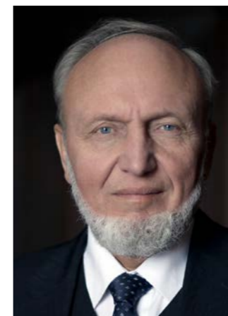
Prof. Hans-Werner Sinn, Referent des diesjährigen Anlegersymposiums

Am 14. Mai 2026 ist es wieder so weit: Das Anlegersymposium des Raiffeisen InvestmentClubs lädt diesmal in die Messe Bozen ein – eine hervorragende Gelegenheit, aktuelle wirtschaftliche Entwicklungen aus erster Hand zu erfahren. Auch in diesem Jahr erwarten die Clubmitglieder interessante Einblicke, die dabei helfen, Anlageentscheidungen fundiert und selbstbewusst zu treffen.