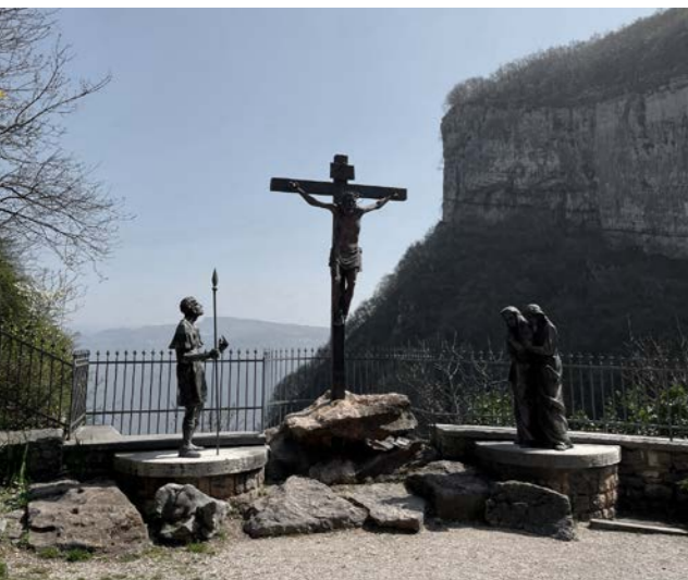
Der Kreuzgang zum Wallfahrtsort

Schon von der Autobahn aus sieht man die Kirche in der Felswand „Madonna della Corona“ und man fragt sich sofort, warum sie hier gebaut wurde – unsere Neugier ist geweckt. Wir starten in Brentino Belluno neben der Kirche, schlendern durch das charmante Dörfchen über