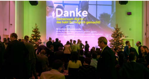
L'evento, tenutosi il 27 novembre scorso, ha consentito di stilare un primo bilancio dei risultati raggiunti

Negli ultimi anni, le Casse Raiffeisen dell'Alto Adige hanno portato a termine il processo di transizione digitale. All'insegna del motto "Insieme digitali", dal 2022, hanno lavorato alacremente allo scopo di semplificare e ammodernare la gamma di proposte, accrescendo il comfort della clientela.