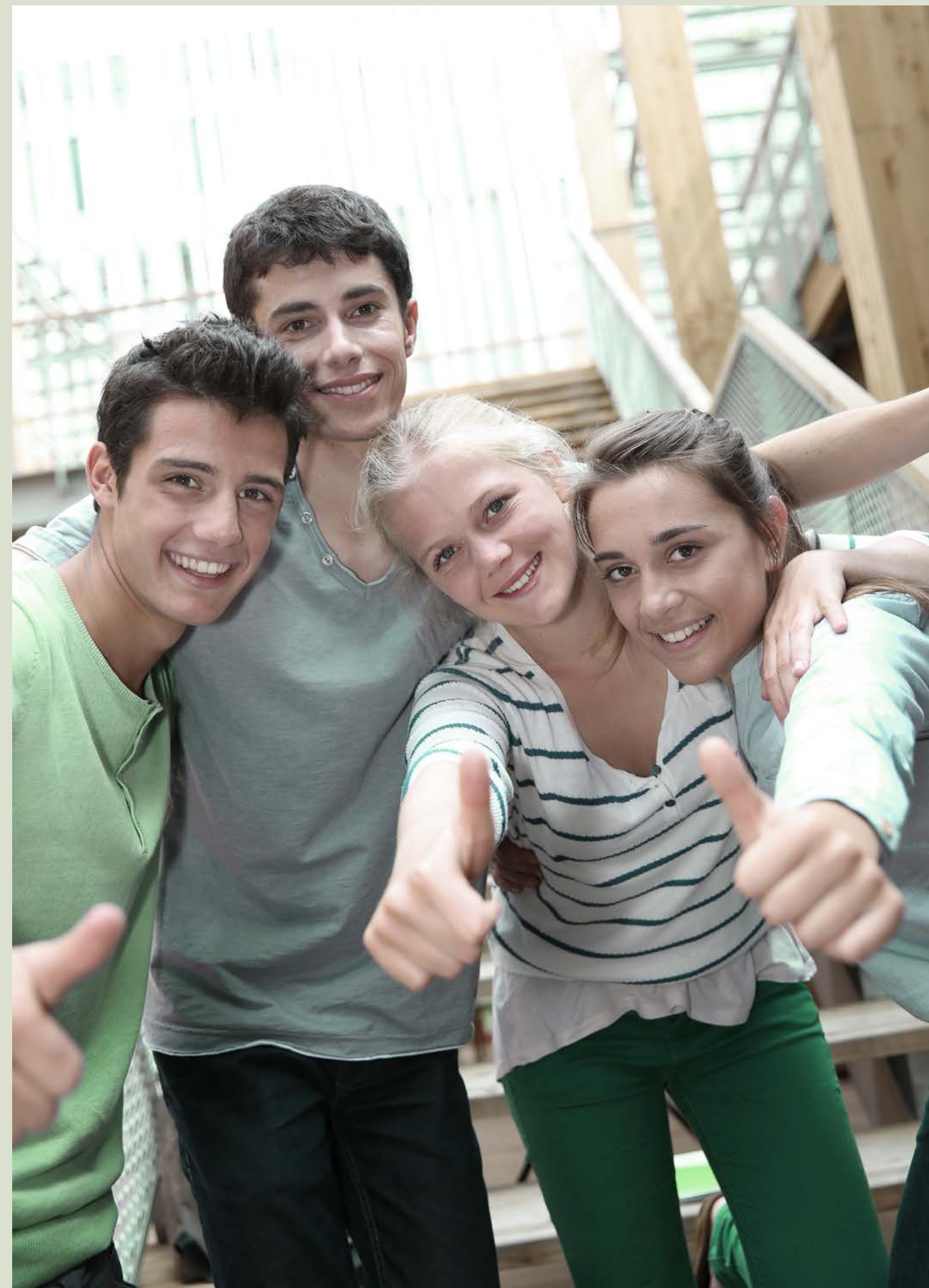
Educazione finanziaria vuol dire anche apprendere la gestione del denaro con strumenti ludici