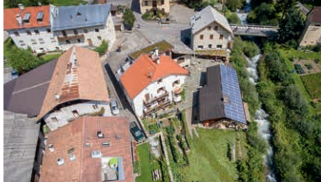
Il nuovo caseificio (l'edificio bianco in alto a destra) con il negozio del maso

Negli ultimi dieci anni, l'azienda Enghorn ha sperimentato molti cambiamenti, tra cui la costruzione di una stalla a stabulazione libera per le vacche con corna, il risanamento dell'abitazione e l'installazione di un impianto fotovoltaico