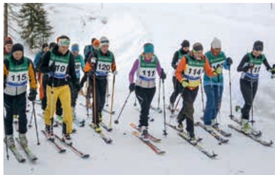
Quest'anno, la gara di sci uphill ha suscitato un notevole interesse: 18 scialpinisti si sono sfidati per realizzare il migliore tempo di ascesa

A inizio febbraio, il comprensorio sciistico di Plan ha ospitato la 42ª Giornata degli sport invernali Raiffeisen, cui hanno aderito circa 500 collaboratori, consiglieri e sindaci delle Casse Raiffeisen dell'Alto Adige. Anche quest'anno, la partecipazione è stata notevole: ben 125 collaboratori hanno gareggiato per realizzare il tempo migliore. Nella classifica a squadre, la Cassa Raiffeisen Val Badia ha ammaliato con la sua magistrale performance, battendo RUN S.p.A. e la Cassa Raiffeisen Castelrotto-Ortisei. La filiale con il maggior numero di partecipanti è stata la Cassa Raiffeisen San Martino in Passiria. Questo tradizionale evento ricreativo dell'Organizzazione Monetaria Raiffeisen è stato organizzato dalla Federazione Cooperative e dalla Cassa Raiffeisen della Val Passiria.