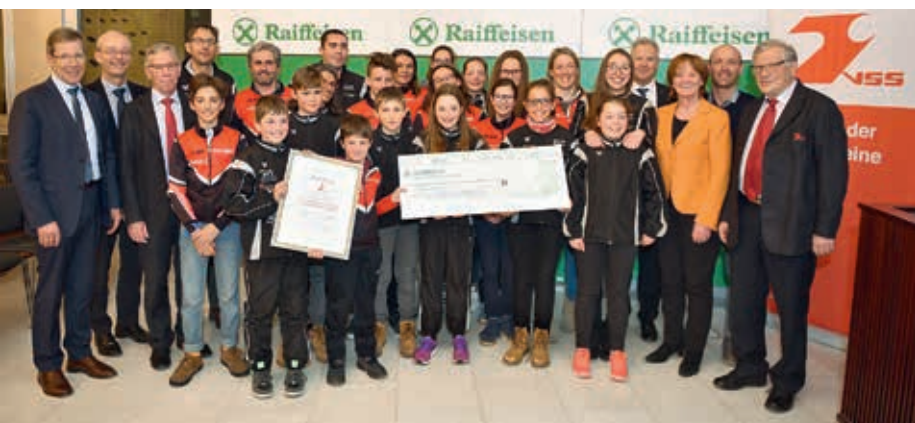
I giovani atleti dell'ASC Lasa e dell'ASV Prato alla premiazione, a Bolzano

Le associazioni sportive altoatesine svolgono un lavoro eccezionale con i giovani. Per fare in modo che tale impegno venga adeguatamente riconosciuto, ogni anno, la VSS insigne alcuni progetti particolari, che non si limitano ai meri risultati, del premio "Un'attività giovanile esemplare all'interno dell'associazione sportiva". L'iniziativa, generosamente finanziata dalle Casse Raiffeisen dell'Alto Adige, intende così valutare e ricompensare gli aspetti sociali. La Val Venosta si è aggiudicata il primo premio 2017 del valore di 5.000 euro: un lungo progetto realizzato dalla sezione