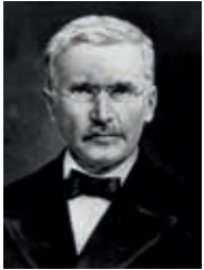
Il fondatore del pensiero cooperativo: Friedrich Wilhelm Raiffeisen (1818 – 1888)

lingue straniere, storia e matematica. A 17 anni entra nell'esercito come volontario. A causa di un problema a un occhio, è costretto ad abbandonare il servizio militare; nel 1843 passa all'amministrazione civile, dove s'impegna subito a favore della popolazione rurale impoverita. Dopo la sua esperienza a Weyerbusch, nel 1848 è nominato sindaco di Flammersfeld. Mentre l'Europa è sconvolta dalle tensioni sociopolitiche ed economiche, l'anno successivo, insieme ad alcuni agricoltori facoltosi Raiffeisen costituisce un'associazione a sostegno dei contadini "privi di mezzi". Lo scopo è quello di consentire a questi ultimi di riacquistare il bestiame ceduto in pegno agli strozzini. Nasce così la prima associazione tedesca a responsabilità solidale e la prima forma di cassa di prestiti, oggi conosciuta con il nome Raiffeisen. Ma tutto questo non gli basta: nella consapevolezza che l'attività caritatevole e l'amor prossimo cristiano non costituiscono una base sufficiente, punta ancor di più sull'autoaiuto cooperativo e sull'unione delle forze a beneficio della collettività, dando un impulso alle risorse produttive scaturite dall'industrializzazione. A tale scopo, ha però bisogno di "denaro e delle conoscenze per impiegarlo nella maniera più utile possibile", come scriverà nel 1866 nella sua opera principale ("Die Darlehenskassen-Vereine als Mittel zur Abhilfe der Noth der ländlichen Bevölkerung sowie auch der städtischen Handwerker und Arbeiter").