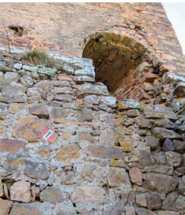
Accesso alle rovine di Castel Greifenstein (Castel del Porco)

Rifocillati, scendiamo lungo il sentiero 11 B in direzione San Maurizio: il percorso, scivoloso e accidentato, richiede passo fermo. Dopo ca. 20 minuti ci troviamo immersi in un'atmosfera mediterranea, tra palme, cactus e agave: qui, in primavera, anche il gelsomino d'inverno fiorisce in tutta la sua bellezza. La vigorosa crescita dei cactus si deve ai pendii porfirici, che in estate raggiungono temperature da clima desertico. Scendendo lungo il sentiero lastricato, nel giro di mezz'ora, approdiamo a San Maurizio. Qui proseguiamo sino alla fermata "Zona Cactus", dove prediamo l'autobus che ci riporta a Settequerce. _ol