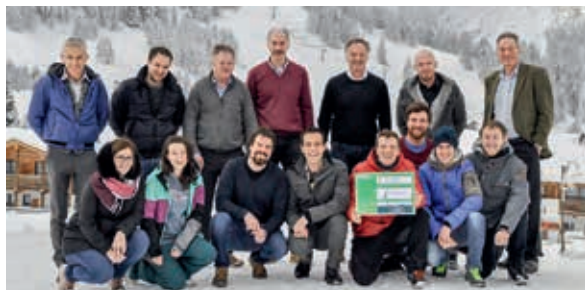
La 1ª Bike & Ski Nightrace ha donato 12.000 euro all'Associazione per bambini con tumore "Peter Pan"

A inizio gennaio, sul ripido pendio della pista Bullaccia (Alpe di Siusi) ha avuto luogo la prima Bike & Ski Nightrace, un particolare spettacolo sovvenzionato dalla Cassa Raiffeisen Castelrotto-Ortisei, che ha riunito alcune star della Coppa del Mondo di sci e motociclisti Harley-Davidson. Dopo il sorteggio delle coppie, si è aggiudicata la vittoria quella che ha percorso il maggior numero di metri nel minor tempo. La sezione dell'Alpe di Siusi dell'HGV (Unione albergatori e pubblici esercenti dell'Alto Adige) e gli Junge Alpler hanno deliziato i circa 3.000 spettatori con bevande calde, raccogliendo le loro donazioni: un totale di 12.000 euro interamente devoluti all'Associazione per bambini con tumore "Peter Pan".